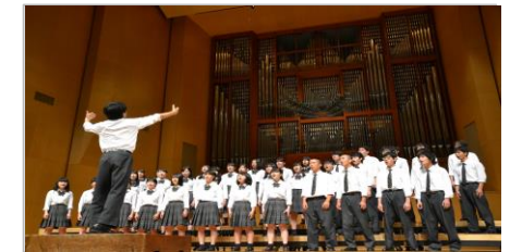
合唱祭(於国立音大講堂大ホール使用:高大連携協定校)