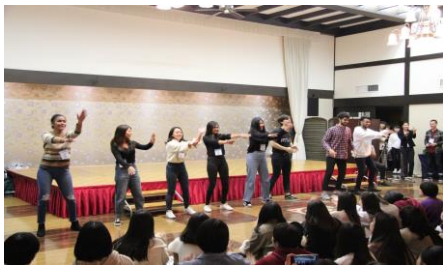
進路探索研修旅行