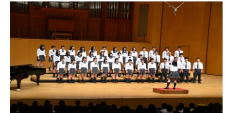
合唱祭(於国立音大講堂大ホール使用:高大連携協定校)