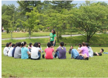
アメリカンサマーキャンプ