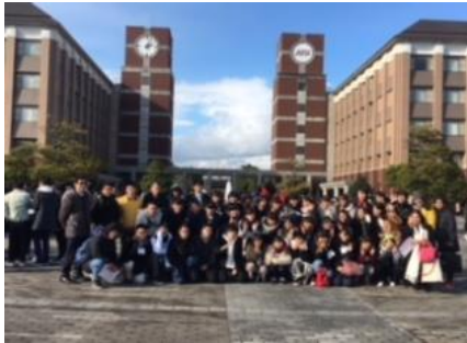
進路探索研修旅行